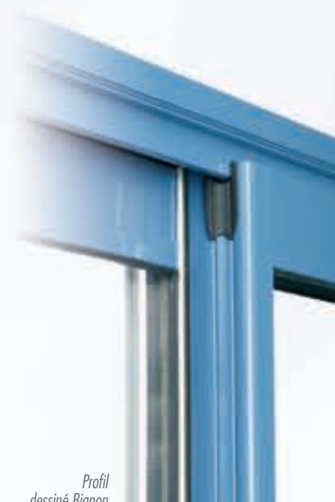
Profil dessiné Bignon